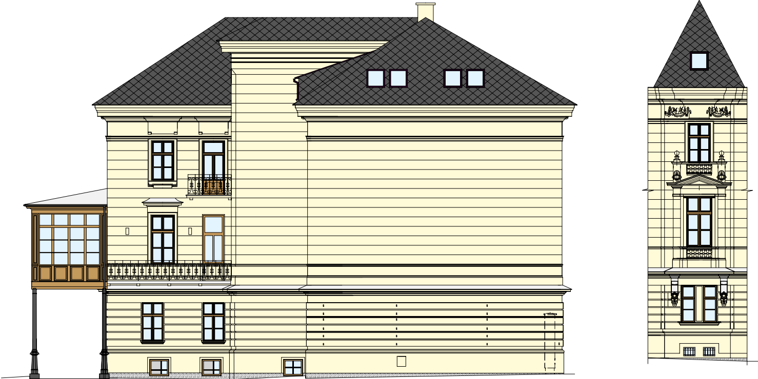
POHLED JIHOZÁPADNÍ - ČELNÍ POHLED NA ARKÝŘ